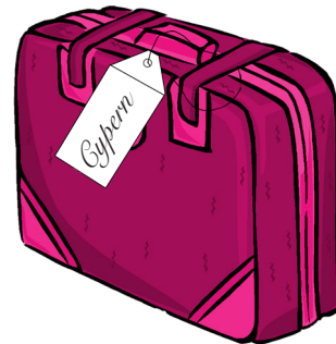
11. Apg 4:36