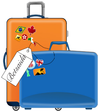
7. Joh 1:44