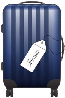
6. Apg 21:39