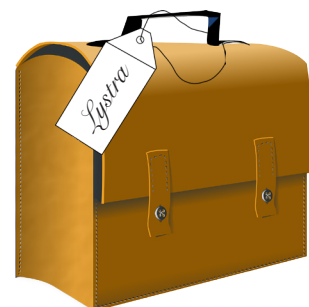
12. Apg 16:1