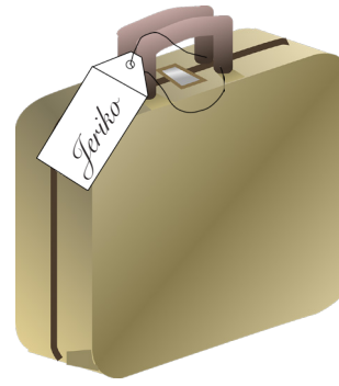
9. Luk 19:1-2