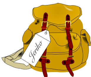
8. Luk 10:30-37