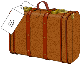
5. 1 Mos 11:31